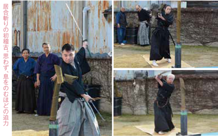
居合斬りの初稽古。思わず、息をのむほどの迫力

③石清水八幡宮「男山桜まつり」武道大会に参加。「明日香おもしろ歴史フェスティバル」「関市刃物祭」「あづち信長祭」「石上神宮奉納演武」にて、居合斬りの普及に努め、大勢の方々に楽しんでいただいています。 そのほか、年に1、2回、総合体育館研修室にて「日本刀セミナー」を実施しています。