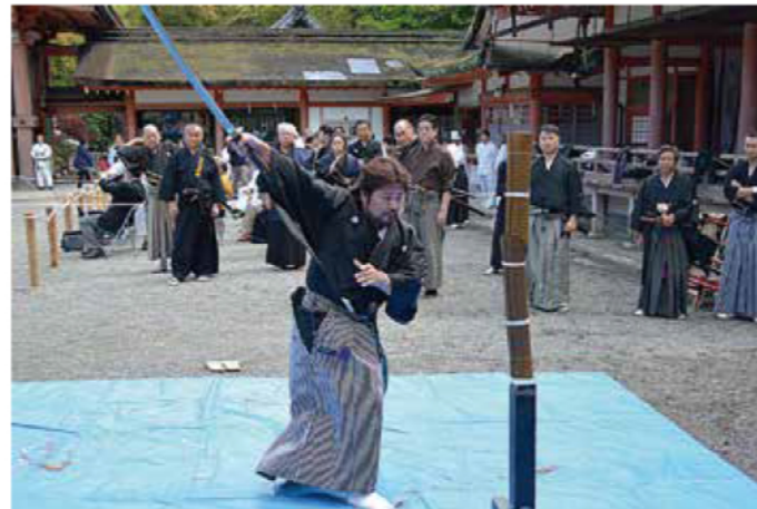
石清水八幡宮で毎年開催される「男山桜まつり」での試斬の様子

老若男女の健康づくり・非日常的な癒し、居合道による礼儀・作法・所作の美しさを伝えるため、日々の稽古を大切にしています。また、各流派の教義を尊重して、皆が仲良く楽しめる、憩いの場となっています。