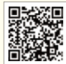
◀チケットぴあQRコード

市民公益活動支援センターは、「非営利」かつ「不特定多数の利益」となる、市民公益活動をサポートしています。