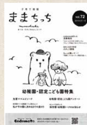
「子育て情報 ままちっち」地域のママの口コミ情報が得られると人気