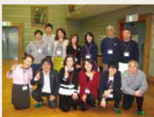
▶実行委員会の皆さん